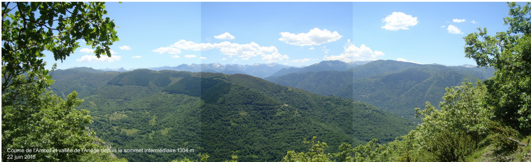
Coume de l'Amont et vallée de l'Ariège depuis le sommet intermédiaire 1304 m 22 juin 2016

Jackie, incommodée par la chaleur, décide de ne pas monter sur la crête et redescendra avec Jean-Paul. Les 2 increvables attaquent la crête et découvrent au loin les sommets au sud sur la frontière.