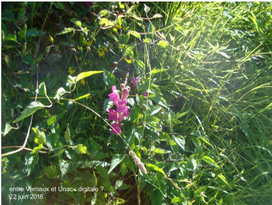
entre Vernaux et Unac : digitale ? 22 juin 2016

projet : faire une boucle au-dessus de Luzenac 600 m, passant par Vernaux, Unac, Bestiac, puis monter au col des Carmilles et faire la crête de La Bouiche 1317 m et retour