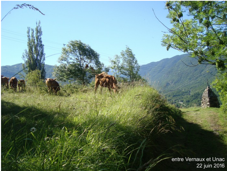
entre Vernaux et Unac 22 juin 2016