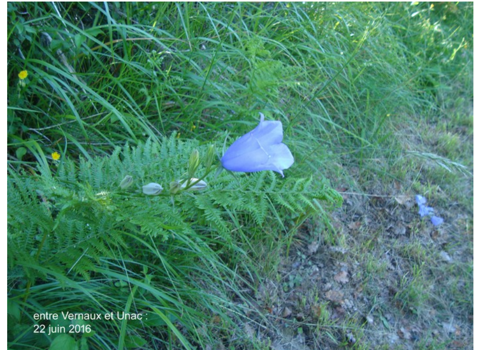
entre Vernaux et Unac : 22 juin 2016