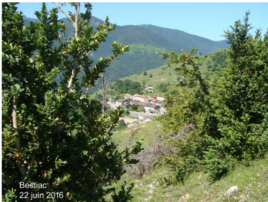
Bestiac 22 juin 2016

montée sur un sentier coupant les lacets de la piste au col des Carmilles 1130 m où nous pique-niquons à l'ombre d'un frêne